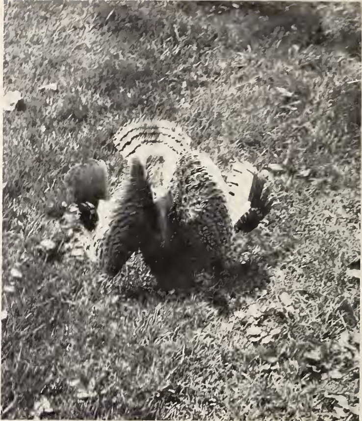
Abb. 7: Abwehdrohen gegen Luftfeind.